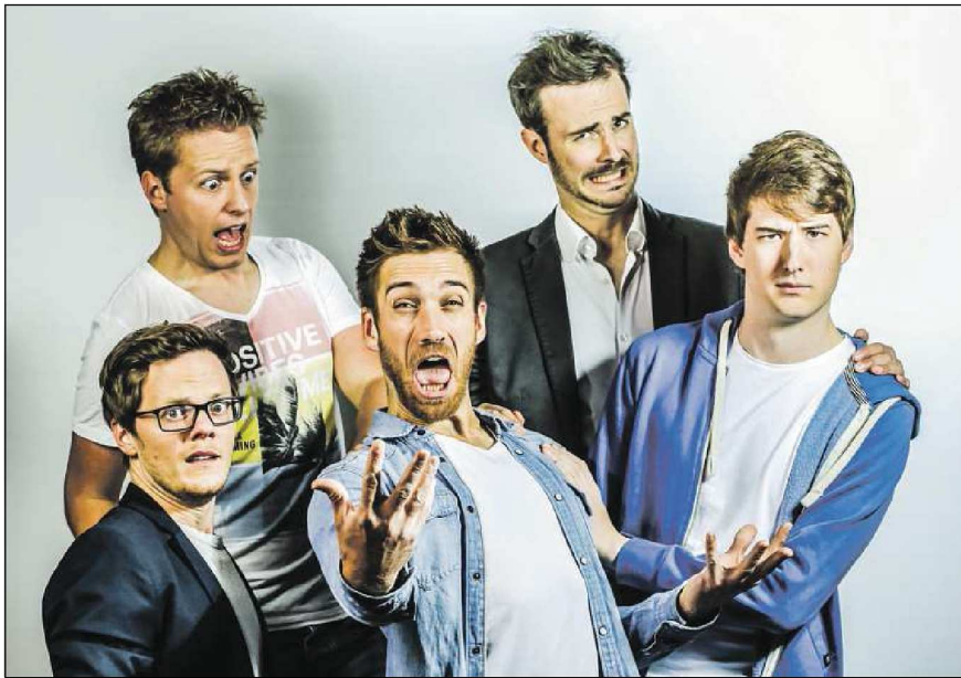
A-Cappella vom Feinsten präsentieren „Fünf vor der Ehe“.

Vom A-Cappella-Konzert bis hin zur Oper am Nachmittag